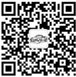
齐鲁晚报·今日菏泽 菏泽车友会官方微信二维码

针对人数比往年多的问题,菏泽市教育局相关负责人表示,教师职业的社会认可度逐年提高,这也让教师资格证考试一年比一年火爆。“同时,就业压力的增大,以及教师工作的相对优越性,也是导致非师范类毕业生报名人数不断增加的原因之一。”