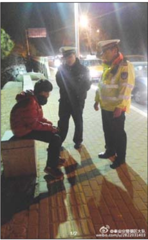
离家少年向交警求助。

本报泰安3月15日讯(记者 曹剑 通讯员 徐贝贝) 12日晚上,一名少年在环山路上向景区交警借手机用,细问原来是负气离家出走,从河南来只带了200元。景区交警将少年送到派出所,13日凌晨2点,家人赶来接走少年。 12日晚上10点左右,泰山景区大队民警巡逻至天外村附近时,一个坐在路边的少年起身上前拦住警车,希望借民警手机打电话。民警称,听男孩说话明显是外地口音,年龄只有十二三岁的样子。 此时天外村基本没有人,游客稀少。男孩身边也没有成人陪伴,这引起了副大队长刘峰的注意。刘峰并没有立即将手机借给男孩,而是仔细地询问他为什么独自在天外村,问他的家里人在哪里、叫什么名字等问题。 民警称,一开始,少年坚持说自己来泰安玩,只不过家里不知道。刘峰并没有因此就放弃,当问到少年是否跟家里人闹了别扭负气离家出走时,少年突然哭了,终于承认自己的