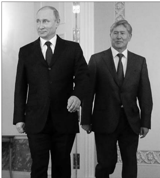
3月16日,在俄罗斯圣彼得堡,俄罗斯总统普京(左)会见来访的吉尔吉斯斯坦总统阿坦巴耶夫。