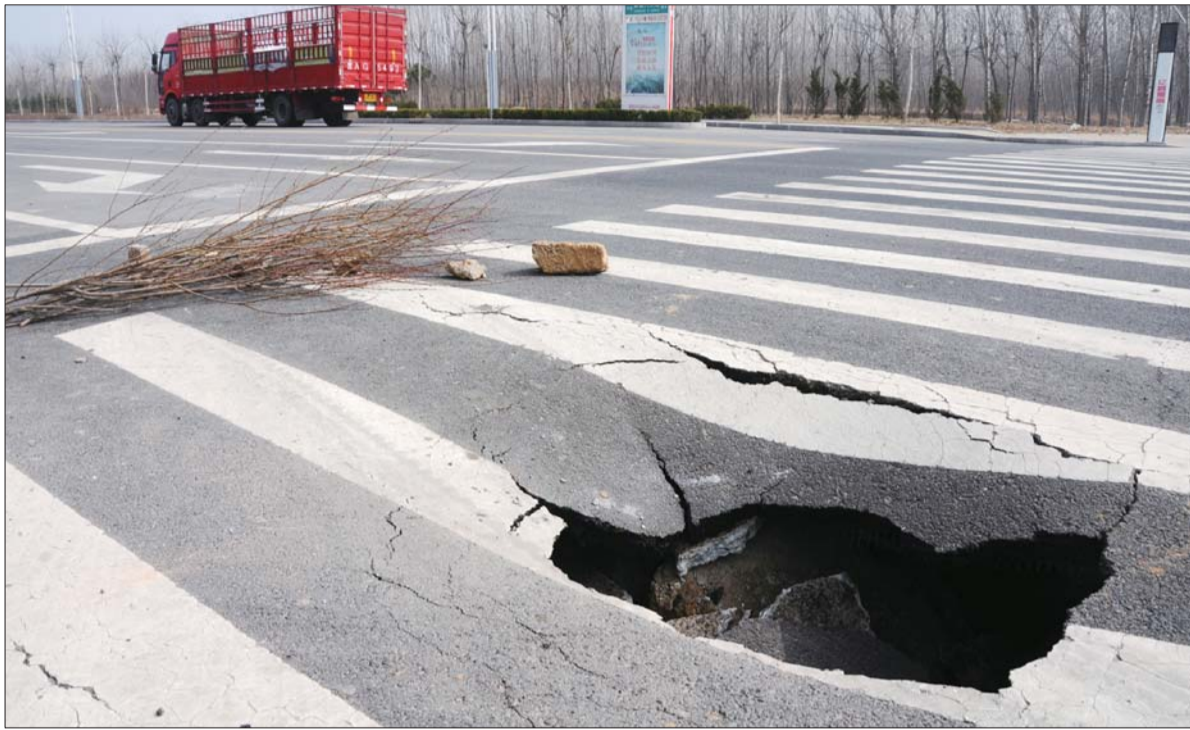
坑内数米宽的范围已完全悬空,仅靠路面支撑。