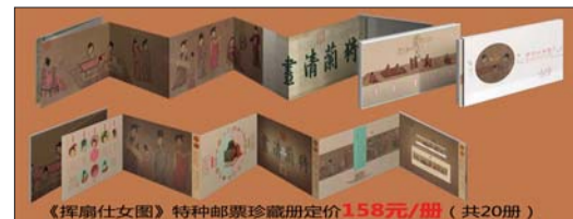
《挥扇仕女图》特种邮票珍藏册定价158元/册(共20册)