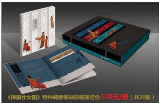
《挥扇仕女图》特种邮票卷轴珍藏册定价338元/册(共20册)

记者从山东省邮政公司了解到,中国邮政自3月22日起开始发行《挥扇仕女图》特种邮票,由于邮票珍贵数量有限,各地市都出现