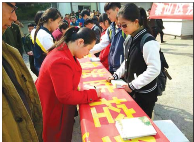
24日上午,医护人员在泰山医学院向大学生普及结核病知识。

目前,还未发现可有效预防结核病感染或发病的疫苗,卡介苗只证实对儿童重症结核病有较好的保护作用。