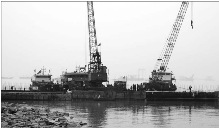
还在施工中的滨州港某系列工程。

海港港区10万吨级码头工程的项目工可报告已经编制完成,工可审查、用海审批正在履行相关手续,并于2014年9月召集省内专家及两家设计院召开了码头结构形式定型会。液体散