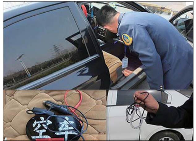
▲执法人员在搜集“黑出租”违法营运的证据。

有一位网友表示:由于章丘出租市场管理比较混乱,非法营运车辆众多。加上正规出租车每月要上交的“份子钱”比较多,导致部分正规出租车司机在计价