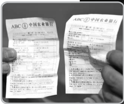
▲王先生打款的收条。