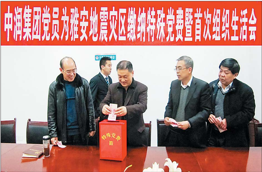
中润党员为雅安地震灾区缴纳特殊党费。