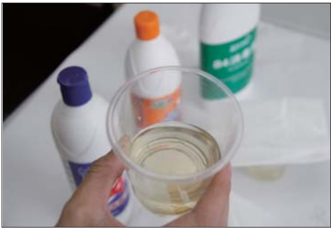
30分钟后其中一个杯子内的头发已经被完全溶掉。

“头发放进消毒液中，居然被腐蚀没了!”近日，有市民在朋友圈中发出这样的信息。是真是假?1日，记者通过实验发现，只需半小时头发就可完全被消毒液腐蚀干净。专家对此提醒，在使用84消毒液时一定要不要让高浓度的消毒液直接接触皮肤。