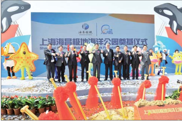
上海海昌极地海洋公园举行奠基仪式。

公园奠基仪式圆满成功,烟台海昌鲸鲨馆同享荣耀,特此将“年卡最惠季”活动时间延长至4月30日,新办鲸鲨馆年卡可享受门市价8折优惠,单人卡206元,双人卡286元,三人卡390元。老会员续卡更享抄底价!一卡在手,全年不限时,无限次畅游海底!鲸鲨馆内将不定期更新海洋动物展示品种,每周末开设“蓝鲸灵”科普课堂,推出各种亲子活动!5月“欢乐海岸”游乐广场将盛大启幕,给你刺激、冒险、快乐的嘉年华!另外,“海昌小小旅行家”活动报名截至4月4日,海选即将拉开序幕,说出你的环保宣言,带上你的环保作品,即可赢取价值万元的台湾亲子游!