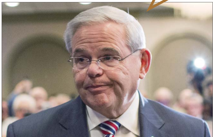
4月1日,在美国新泽西,参议员罗伯特·梅嫩德斯离开新闻发布会现场。