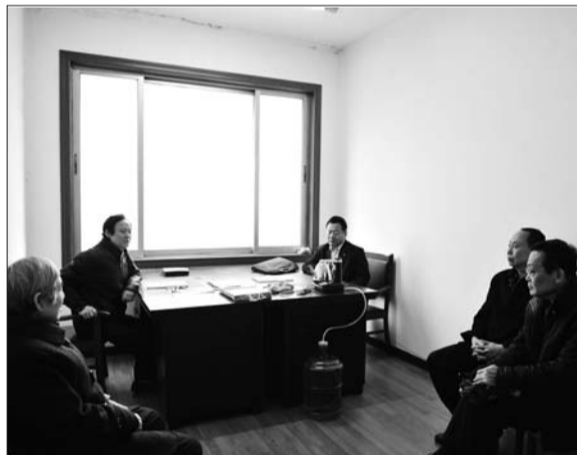
滨州中院审判楼的陪审员办公室。

2014年滨州市委出台了《关于进一步加强和改进人民陪审员工作的意见》,中院组织全市230名新当选人民陪审员进行业务培训,同时对陪审员履职在经济上给予保障,还加强了陪审员业绩考核,去年全市基层法院陪审率达83.7%。在《关于完善人民陪审员制度的决定》颁布实施十周年之际,中院决定进一步加强人民陪审员工作,明确要求中院一审案件人民陪审员参审率不低于30%,进一步拓宽参审案件范围,充分发挥人民陪审员的积极作用。