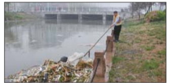
记者在张店玉龙河上游发现的赤泥堆。

对于河中的垃圾,张店区环卫部门要求每天清理,但是沿河的一些市民常常往河道中乱扔垃圾,导致河流水质进一步变差。本报在此提醒市民,为了我们有一个良好的生活环境,请保护我们的城市河流,不要再乱扔垃圾,更不要乱倒生活污水。 本报记者 刘晓