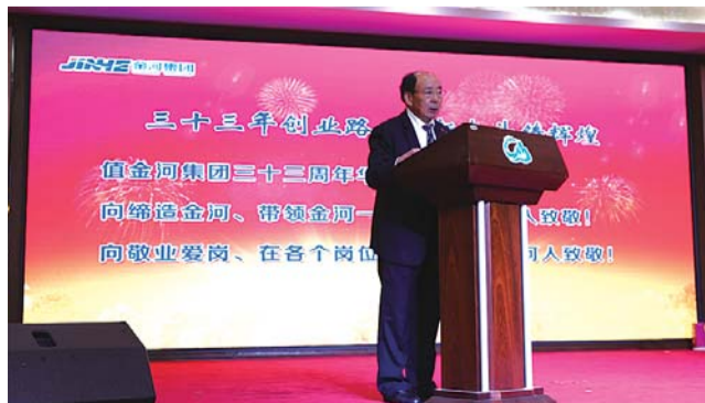
金河集团创业33周年庆典现场。

金河集团打造的颐生苑国际老年公寓以替天行孝、代子女行孝,为社会尽孝的理念,全力打造带产养老新模式。依托磁山深厚的文化底蕴,优美的自然景观,通过人性化、智能化的建筑设计,子女化的服务配套、亲情化的家园氛围,为那些对社会有贡献的老年人创造一个有温馨舒适生活、高雅亲和文化、优美和谐环境的社区,使老年人乐享晚年幸福,感受人生新价值。