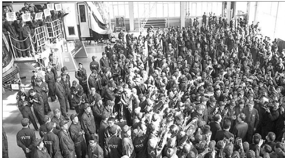
10日，李克强考察北车集团长春客车股份有限公司，工人们打出“感谢超级推销员”的字板。

10日，北车集团长春轨道客车股份有限公司的装备车间欢声雷动，工人们打出“感谢超级推销员”的字板，争相与正在这里考察的李克强总理握手问好。李克强说，中国装备去国际市场上竞争，你们一定确保装备质量，让关键技术人脑入心，把每个步骤和程序精确到位。