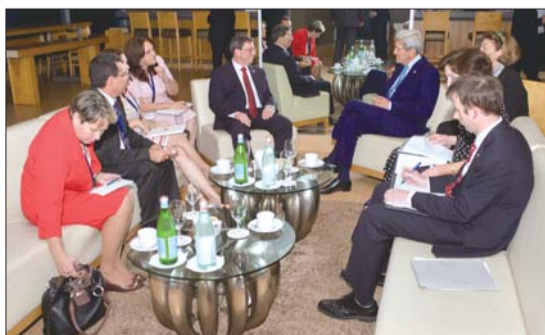
4月9日,在巴拿马城,美国国务卿克里(右后)与古巴外长罗德里格斯(左后)举行会晤。

说一套,做一套,正是美国对拉美政策的两面性,导致了长期以来拉美国家对美国缺乏信任。第七届美洲峰会召开在即,在古美关系破冰所预示的美拉关系回暖与委美关系因美方制裁骤趋紧张的矛盾背景下,参会的拉美国家不能不对奥巴马政府改善美拉关系的诚意和动机产生怀疑。