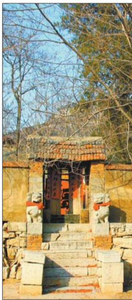
村东古道路北的关帝庙，树木茂密。