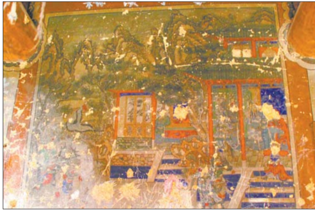
关帝庙主殿内墙壁上保存比较完整的壁画。