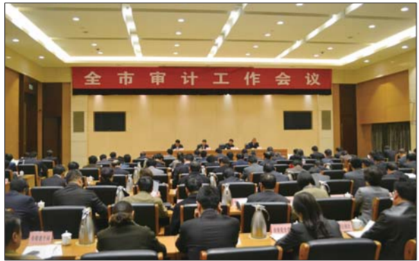
全市审计工作会议举行。

等改革推进,关注财政资金的存量和增量,促进减少资金沉淀,盘活存量资金,关注专项资金绩效,促进优化财政支出结构。重点查处违法违规制定税收等优惠政策、虚增收入等问题,促进依法组织收入。加强对“三公”经费和会议培训费使用、津贴补贴发放、楼堂馆所建设等方面的审计,严厉查处“小金库”、“吃空饷”、奢侈浪费等问题,促进节约型政府建设。