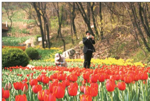
游客正在欣赏五颜六色的郁金香。

红叶谷生态文化旅游区占地4000余亩,是一处以生态和文化为主题的近郊风景旅游区。红叶谷开发建设中以加强环境保护,提升生态质量为指导,以促进可持续发展为前提,筑坝蓄水,涵养水源,实现了污水零排放;植树种草,增加植被,实现了植物多样性;使昔日的偏僻山谷变成了“湖光山色醉游人,禽鸣幽谷和乐章”的绝佳旅游胜地。