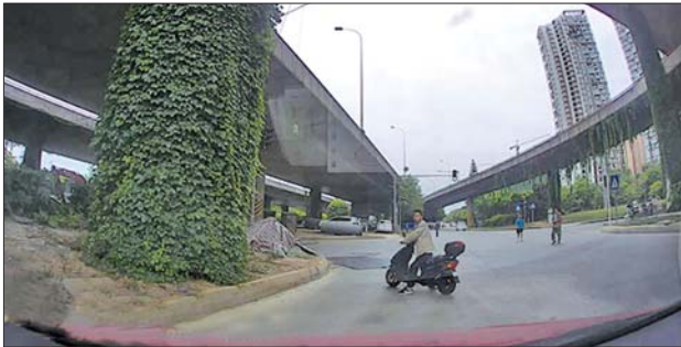
4.张某逼停卢女士后,围观群众向车辆靠近。