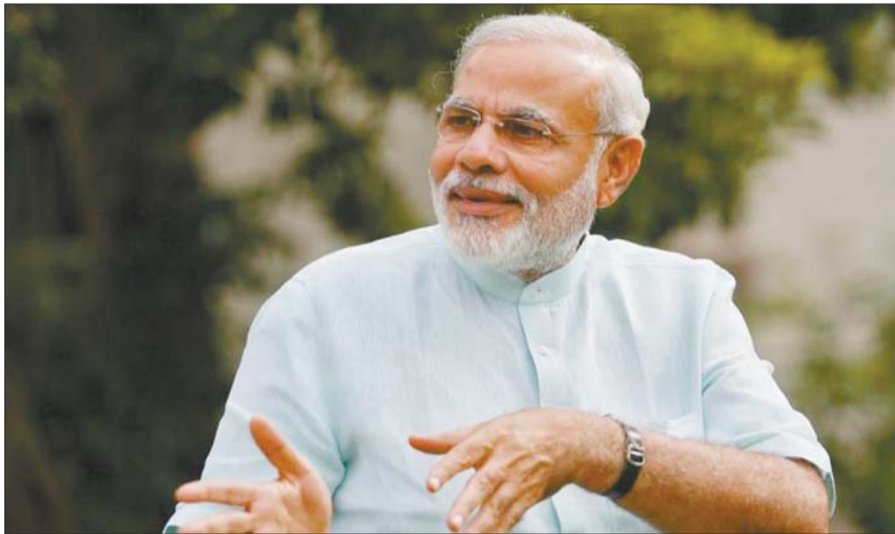
印度总理莫迪 (资料片)