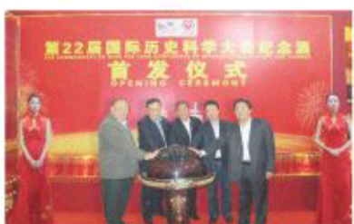
4月25日,第22届国际历史科学大会纪念酒“一带一路”酒首发仪式在山东淄博国际会展中心隆重举行。

2015年8月23日至29日,有着“史学奥林匹克”之称的国际历史科学大会将在山东济南举行,这是大会自1900年创办以来,首次在亚洲国家举办。届时将有数千名中外历史名家云集,共襄盛举。这是我国综合国力和国际影响力显著提升的重要体现,也是进一步展示中华文明,推动中华文化走出去的重大契机,对提升中国国际形象都将产生积极而深远的影响。