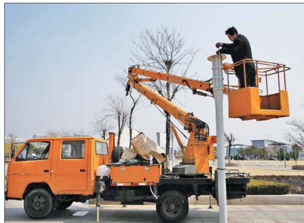
▲乳山银滩工作人员在检修路灯。

据乳山滨海新区工作人员介绍，今年滨海新区还创新便民渠道，将开辟“网上社区”窗口，以“网上交流平台”为载体，分单位设置交流窗口，并安排专人对业主诉求进行办理。“‘网上社区’建立后，居民可以随时随地表达诉求，也搭建起24小时不下班政府，搭建起空间上无零距离、感情上无障碍的诉求沟通。”工作人员说。