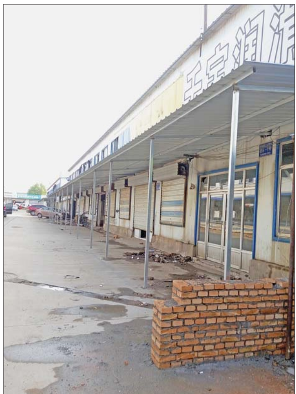
千宝汽配城西区的商户大多都已经搬走。