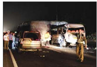
路虎越野车还没上牌就被撞坏。