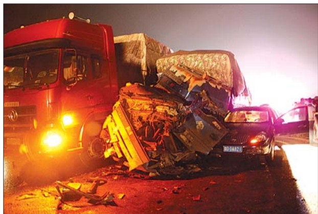
于某驾驶的货车车头损毁严重。