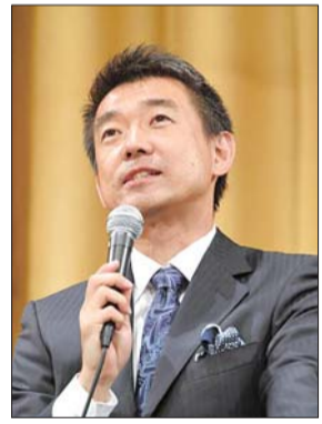
得知投票结果后召开记者见面会的桥下彻。

桥下彻在有关“大阪都构想”的公投遭到否决后立即召开了记者会。他表示,“非常郑重地看待这一结果。(大阪)都构想没有被市民接受,是我未能好好(向民众作出)解释,是我自身能力不足。”他宣布将信守此