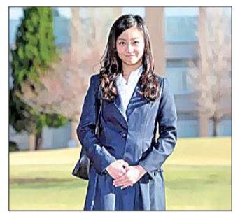
4月2日,佳子公主出席国际基督教大学的开学典礼。

近日,韩国一新闻网站刊登的评论文章在日本引起众怒。该文章的作者在2012年就曾发文称“日本必遭天谴”,如今又把矛头指向日本最具人气的公主——秋筱宫亲王次女佳子公主,称“应送她去慰安妇”。