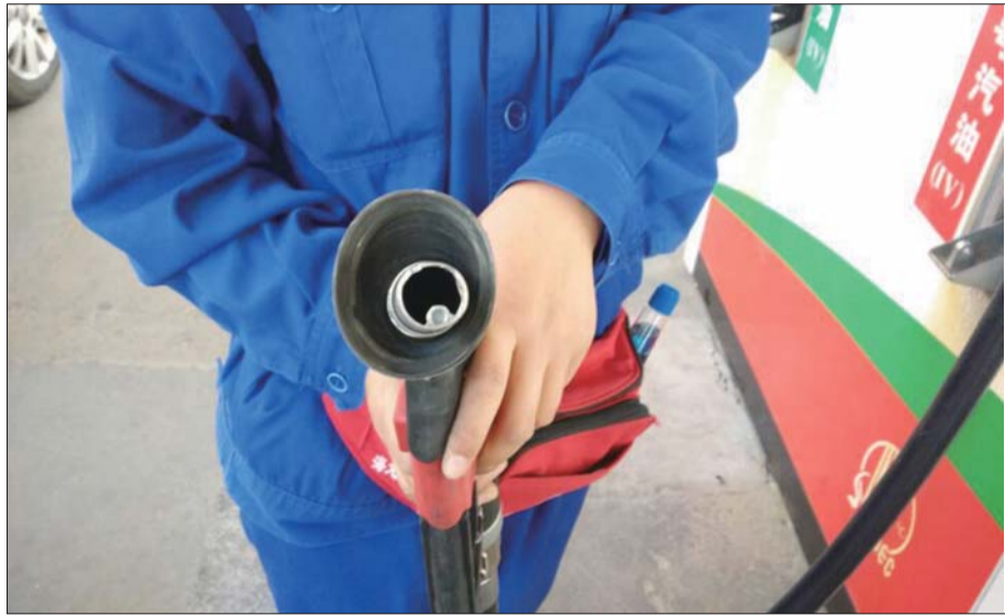
油气通过加油枪枪口上的小圆洞被回收入储油罐。

中石化始终坚持绿色和低碳发展理念和“奉献能源,创造和谐”的企业宗旨。为使顾客享受到绿色、安全的消费环境,中国石油山东滨州销售分公司于2014年开始实施油气回收改造,共投资510万元,为滨州市的蓝天白云再添新保障。油气回收工程投入运营后,该公司加强日常巡检,发现问题及时上报,并通过每年定期检测,切实将油气回收落到实处。