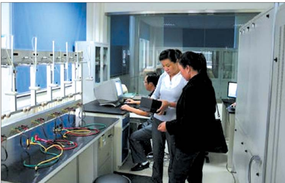
工作人员正在检定市民送检的家用电表。