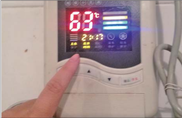
罗女士家太阳能频出问题。

随后,记者来到腾骐骏安售楼处,据工作人员称,目前留在该售楼处的负责人为财务负责人。该负责人见到记者后称上级负责人均在济南。记者通过相关部门提供的电话号码,试图联系该小区销售经理及项