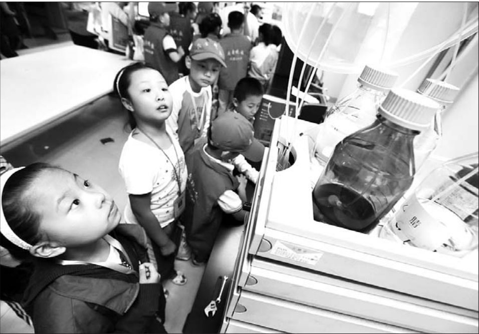
济宁检验检疫局实验室仪器(资料图)。

济宁市科技局等部门在此基础上,出台了《济宁市大型科学仪器设备共享服务管理办法(试行)》,济宁市在省补贴的基础上进行配套政策补贴,补贴金额为检测费用的20%,补贴以“科技创新券”的形式兑现,每年