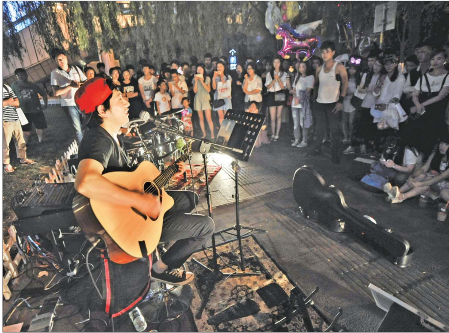
3名有梦想的年轻人组成临时“MK”乐队在路边演唱。

晚上11点半左右，在泉城路一家烧烤店吃烧烤的王先生则认为，来吃烧烤的基本都是自己开车来的，很少有坐公交车的，就算是不开车，现在打车很方便，顾客几乎都是选择打车。“不少在这里吃烧烤的都是附近的居民，肚子饿了就来找些吃的，根本用不着坐公交车。”他说。