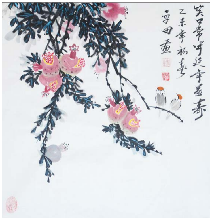
笑口常开,延年益寿