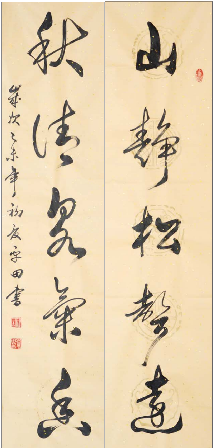
山静松声远,秋清香气香