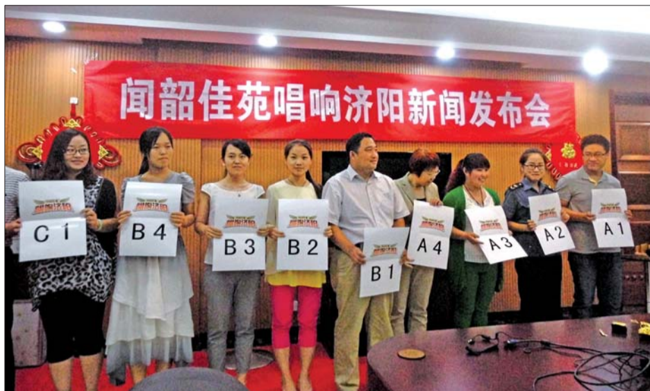
经过抽签,各代表队决定了分组和出场顺序。

本报6月25日讯(记者 杨擎) 为活跃市民文化生活,充分展示济阳县人民奋发向上的精神面貌,2015年“唱响济阳”歌唱比赛将于7月2日举行。据了解,本次比赛有14支代表队参加,共18场比赛,由山东会兴置业有限公司全程赞助。