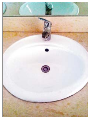
▲打开阀门后,洗手盆内没有水流出。

据商河县长途汽车总站的工作人员介绍,端午节之前工作人员发现车站卫生间内洗手盆处存在跑水、漏水的情况。“端午节假期,车站来往的人数较多,为了保持卫生间的整洁,也为了能节约水源,就关闭了三个水管。”维修人员检查后发现,其中三个洗手盆存在管道老化的问题,于是将三处洗手盆阀门进行了关闭。据了解,目前维修人员正在对管道老化进行维修,工程大约需要一周时间。