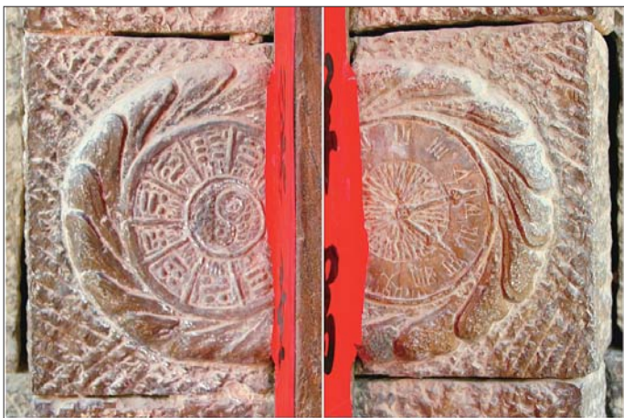
南大门卡框石上雕刻的阴阳八卦和西洋钟表的图案。