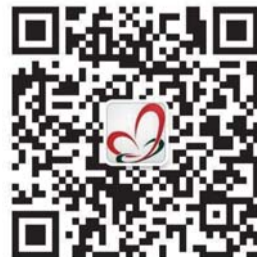
菏泽市中心血站官方二微码