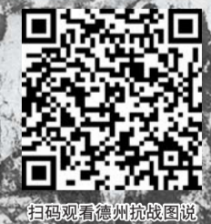
扫码观看德州抗战图说