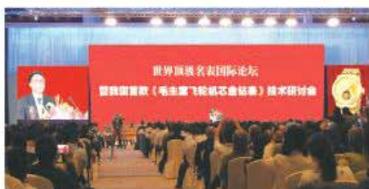
2015年5月《毛主席飞轮金钻表》制表大师团队技术研讨会发布现场

特大喜讯：前30名领取者特别获赠价值1180元（抗战胜利70周年—七大伟人纪念金币）；一次领取2套再送（毛主席黄金纪念钞）