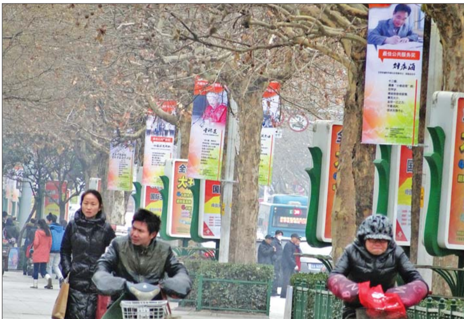
1月21日,本报评选出来的济南市第三届责任市民海报亮相济南最繁华的商业街泉城路(资料片)。

共服务文明。他们虽然平凡,但他们的事业中所蕴含的诚信、奉献等品质,则彰显出济南的城市精神。本报与安利(中国)日用品有限公司继续联合推出