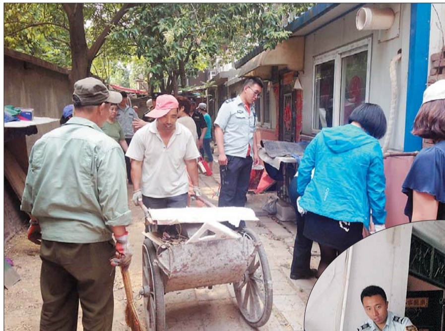
居委会与城管一起协调四区十六楼居民,清理楼前废旧垃圾。