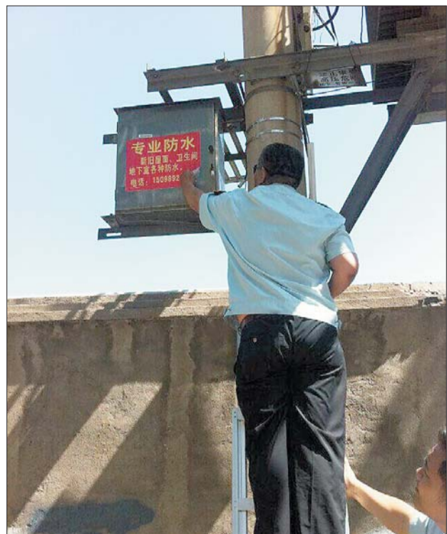
▲旬柳街道城管第四工作站工作人员清理小广告。

小区内农贸市场,也发生了翻天覆地的变化,干净整洁的环境,不论是在此经商的商贩,还是社区居民,连连夸赞“创卫”取得的成果。