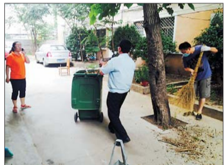
▲旬南社区工作人员对社区环境进行整治。