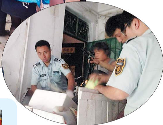
▲一住户自行建造的简易箱,内有许多垃圾,经城管与居委会多次协调,居民终于同意拆除。