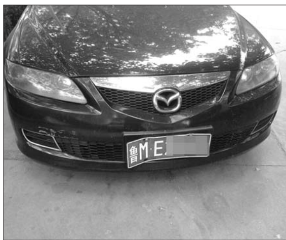
轿车车牌原来有点翘,现在有点弯。

李春玲最后将此事发在微信朋友圈。网名为“赵旭阳妈妈”朋友说:“满满的正能量,可能是小学生骑车子一不小心碰到了。虽然事情不大,但是却说明了一个道理:每个人都真诚地对待每件小事儿,这个世界将阳光普照!”朋友圈内的好评,让李春玲更想找到这个孩子,她说:“我想告诉孩子,这不是他的错,也希望孩子纯洁的心灵能够得到认可并保持下去。”