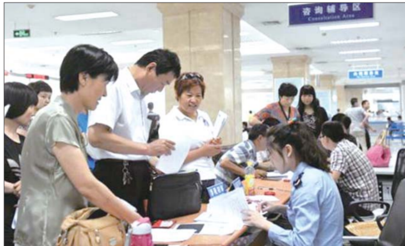
以后网签业务不用都去挤房产大厅了。(资料片)