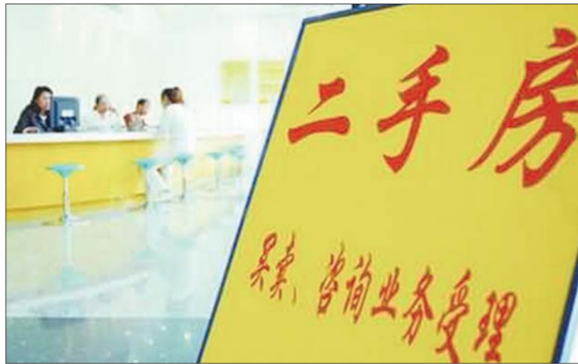
以后二手房网签所有中介都可以办了。(资料片)

买方、卖方和中介都能通过登录“济南市房地产综合信息网”,输入房源核验编码,来查询房源的最新情况。买方及时了解了房源的最新变化,可减少此前因房源情况变化造成的各种纠纷。