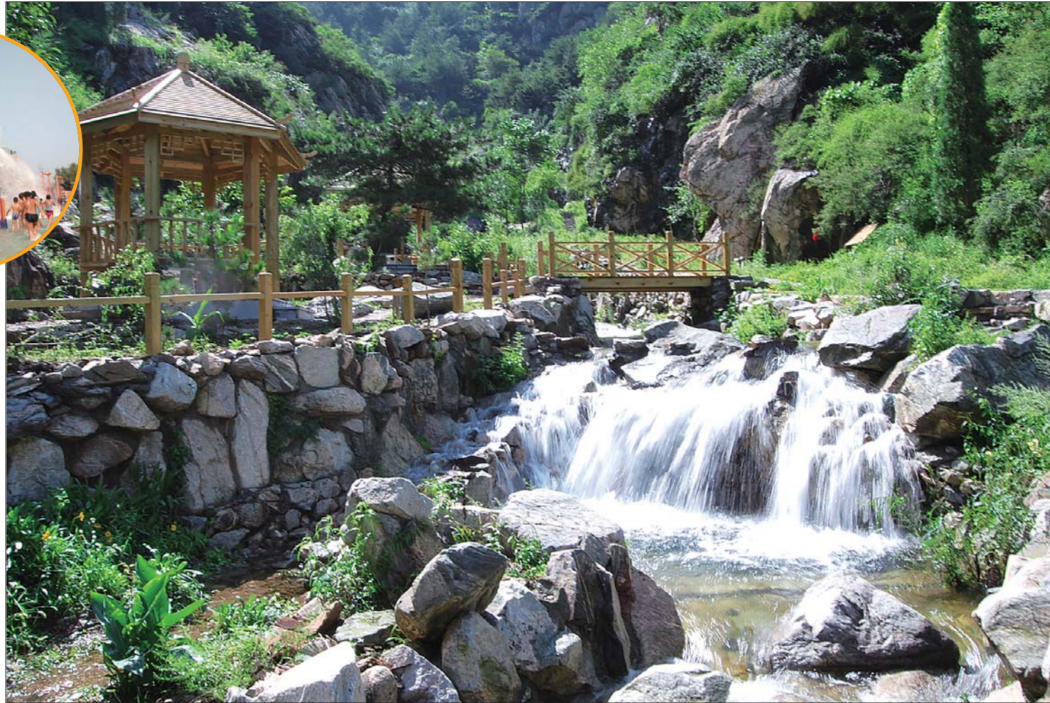
水帘峡景区 (资料片)