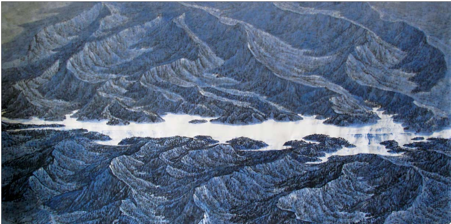
▲生命之源(国家收藏) 248 x129cm

“优秀的画作是有思想有生命的,艺术更深层的东西是传达思想。绘画究竟给现代人传达什么?给予什么?需要画家来思考……”。当今绘画纷繁多样,各种艺术形式、潮流、意识不断涌现,艺术家如何给文化定位,如何理解东西方绘画,如何理解传统和当代,著名画家李耀林深入浅出地讲述了自己的独特艺术见解。