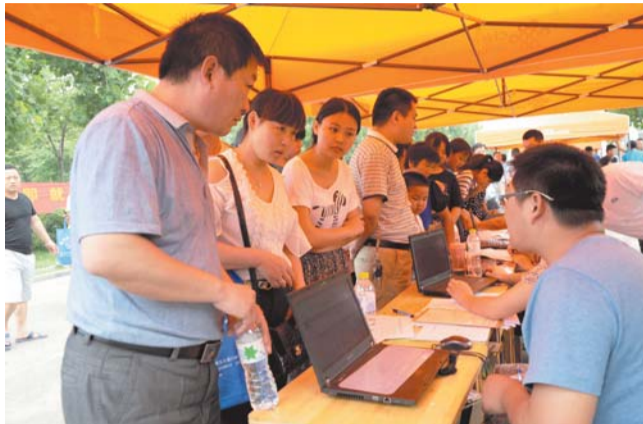
老师向家长详细介绍专业情况

据悉,本次活动以相应全国“职业教育活动周”精神为主题,旨在打造“招生即招工、毕业即就业”形象品牌,加快发展现代职业教育,是发挥我国巨大人力优势,促进大众创业、万众创新的战略之举。“职业教育活动周”的设立,目的是要在全社会弘扬劳动光荣、技能宝贵、创造伟大的时代风尚,形成“崇尚一技之长,不唯学历凭能力”的良好氛围。