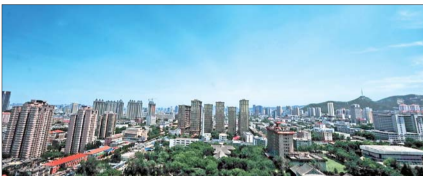
近来，济南市的蓝天明显多起来。本报记者 周青先 摄