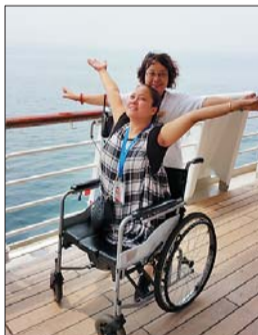
志愿者与残疾人合影。