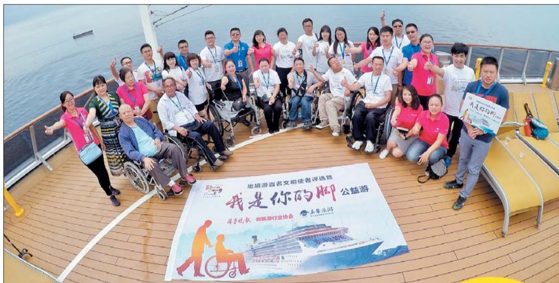
公益团友在大西洋号邮轮甲板上举办读书会。