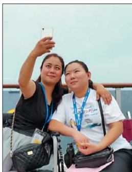
两位残疾人海上留念。