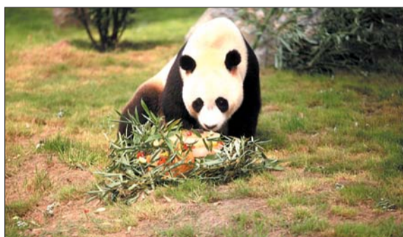
济南动物园大熊猫要过5岁生日。