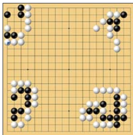
【过关斩将】第二轮第3关图