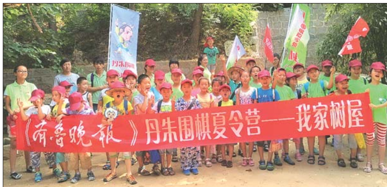
丹朱围棋夏令营快乐之旅